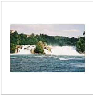
Cascate del Reno vista anteriore