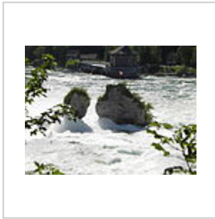
Cascate del Reno vista posteriore