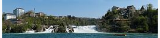
Panorama delle cascate

Altri nomi Cascate di Sciaffusa Rheinfall